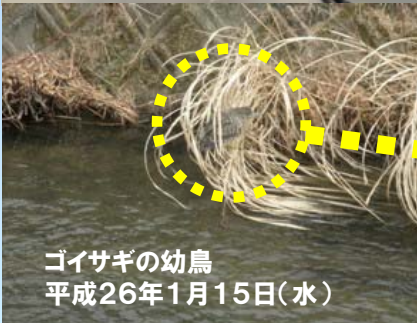
ゴイサギの幼鳥 平成26年1月15日(水)