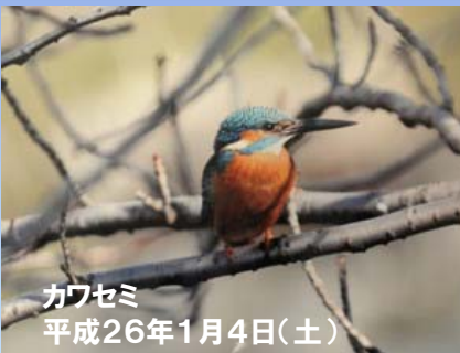
カワセミ 平成26年1月4日(土)