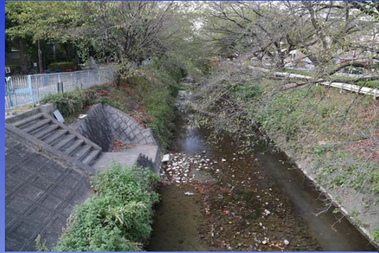
黒川1号橋付近 平成25年9月26日(木) 報告:かわせみ調査隊

堀川の上流の黒川2号橋付近の目視観察で在来種のコイ、フナ、ニゴイ、オイカワ、カマツカ、ナマズの6種。外来種のカムルチー(ライギョ)、ブラックバス、ブルーギル、アロワナの4種を確認しました。この魚たちを餌にするカワセミ、コサギの姿も見られました。