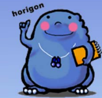
錦橋 平成25年11月1日 報告:かわせみ調査隊