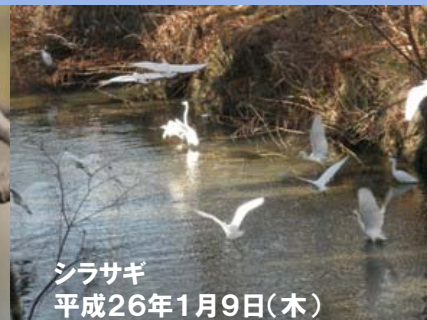
シラサギ 平成26年1月9日(木)